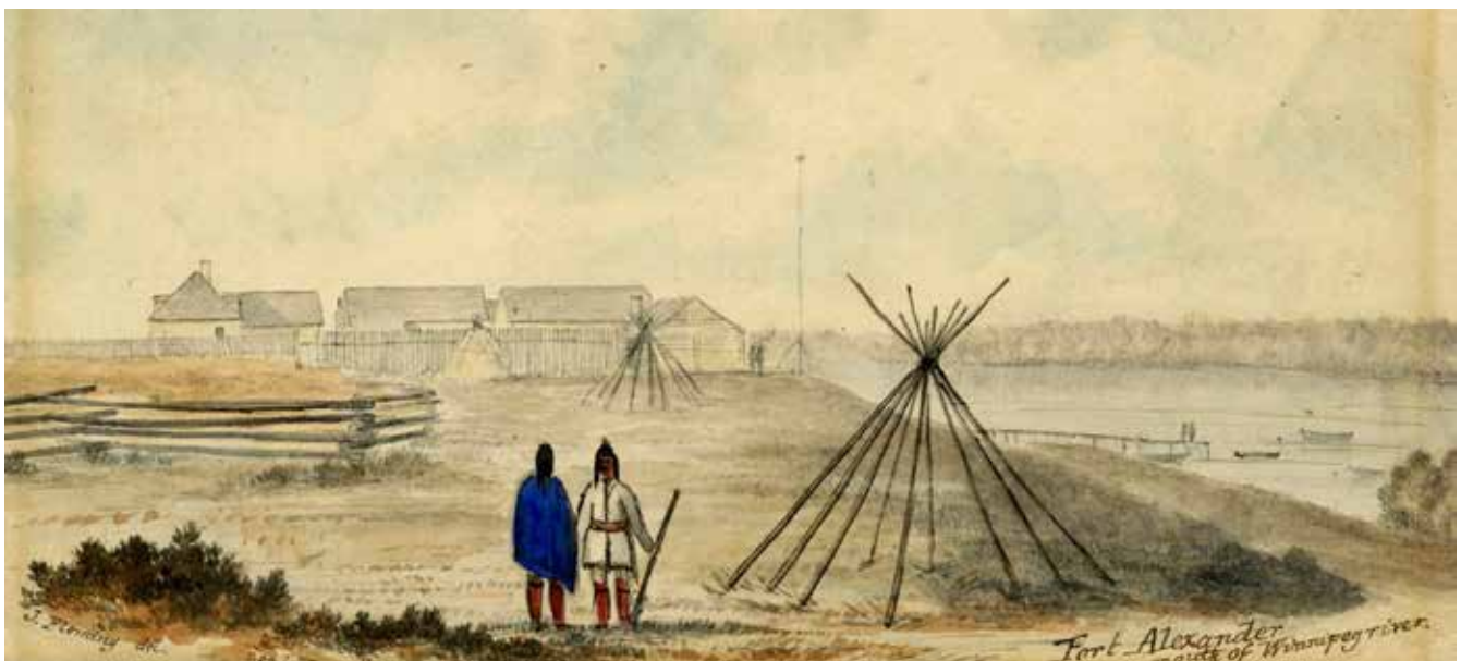
Voici une représentation de Fort Alexander (près de Sagkeeng First Nation) en 1857. L'artiste s'appelle J. Fleming.

« C'était un fort en bois, fait en piquets de chêne fendu en deux. Il y avait des maisons à l'intérieur. La maison du patron, deux hangars, une forge, des granges et des étables, une glacière, et un tour de sentinelle au-dessus. Elles étaient larges et habitées; et dans la maison du patron il y avait des commis, interprètes et leurs domestiques. Les maisons des hommes logeaient 20 hommes chaque. »